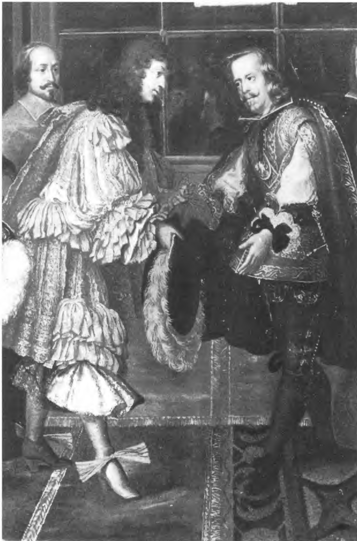
Entrevista entre Luis XIV y Felipe IV (detalles de un cuadro alegórico de la Paz de los Pirineos, por Adam Frans van der Meulen, Biblioteca Nacional, París)